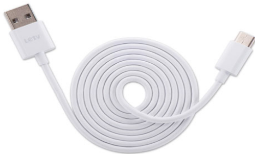
图 1 Type-c线

软件： FactoryTool-1.72.7 工具、 DriverAssitant_v5.1.1 工具、 相应版本的 RK 系列板卡固件。